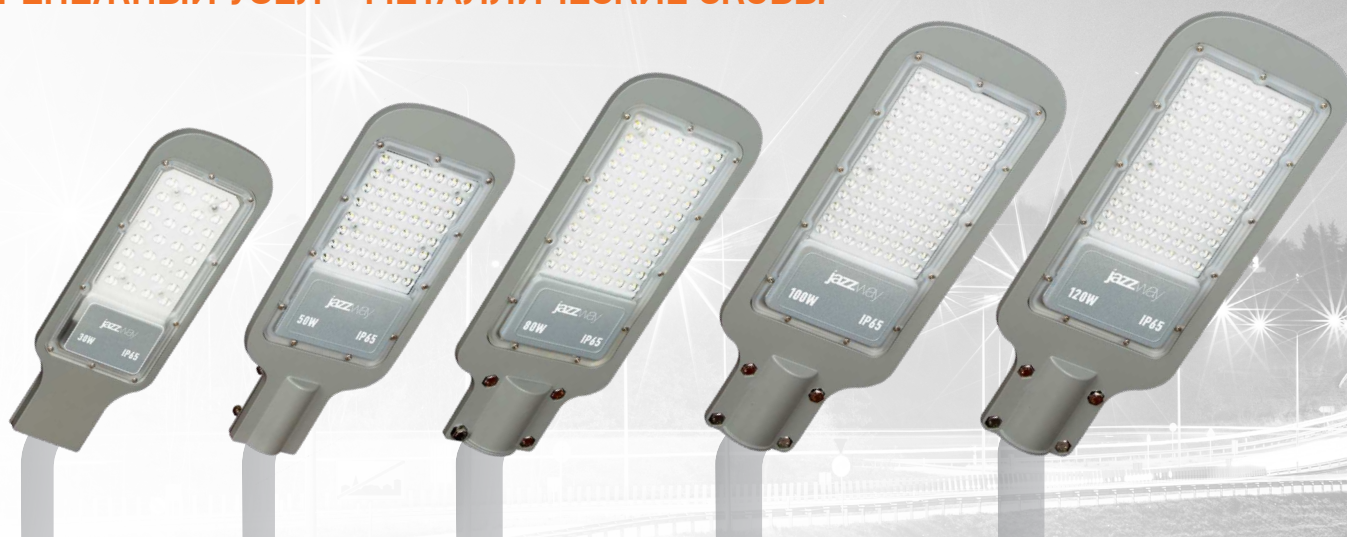
PSL 07 30w