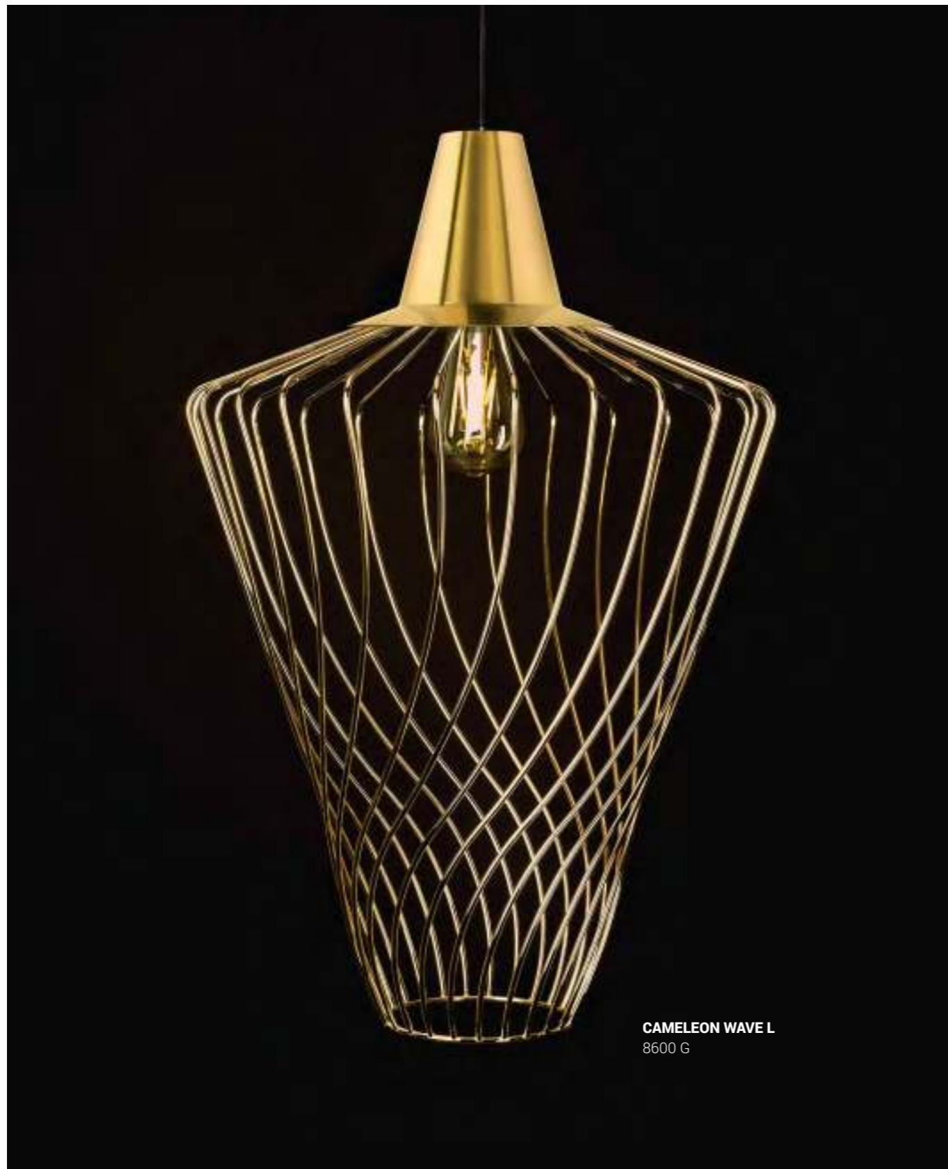
CAMELEON WAVE L 8600 G