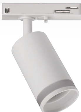
PTR 28 GU10 WH