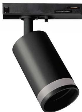
PTR 28 GU10 BL

ЦВЕТОВАЯ ТЕМПЕРАТУРА И МОЩНОСТЬ НА ВАШ ВЫБОР НАДЕЖНЫЙ И ЛЕГКИЙ АЛЮМИНИЕВЫЙ КОРПУС ПОДХОДЯТ ДЛЯ ДИММИРУЕМЫХ ЛАМП