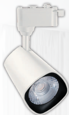
PTR 1615 15w WH