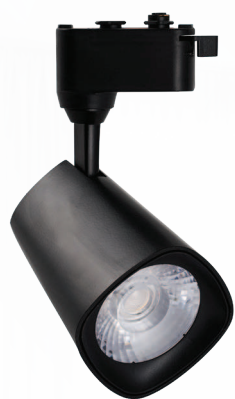
PTR 1615 15w BL